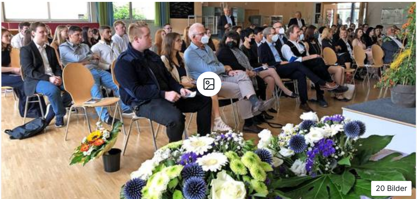
Zeugnisse, Blumen und gute Wünsche für die Absolventinnen und Absolventen