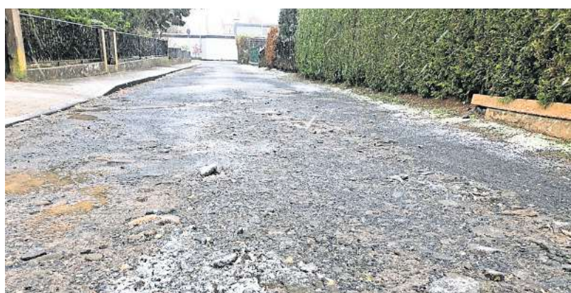
Desolater Zustand: Die Fahrbahn des Tennisweges in Duderstadt.

Nach dem schriftlichen Hinweis eines Anwohners mussten zuletzt Schlaglöcher im Tennisweg ausgebessert werden. „Solche Arbeiten der laufenden Unterhaltung und Instandsetzung reichen aber bei weitem nicht aus, den desolaten Zustand der Fahrbahn zu beheben“, hieß es in der Begründung der ursprünglichen Beschlussvorlage der Verwaltung, über die der Ausschuss jedoch gar nicht mehr abstimmt. Die Vorlage sah zwei Varianten vor: den Ausbau der Straße mit einer grundlegenden Erneuerung der Fahrbahn oder eine Rückstellung des Vorhabens „bis auf Weiteres“.