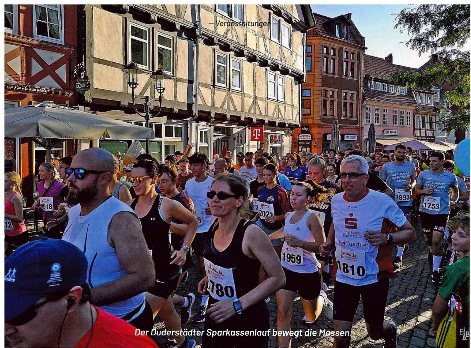
Der Duderstädter Sparkassenlauf bewegt die Massen.