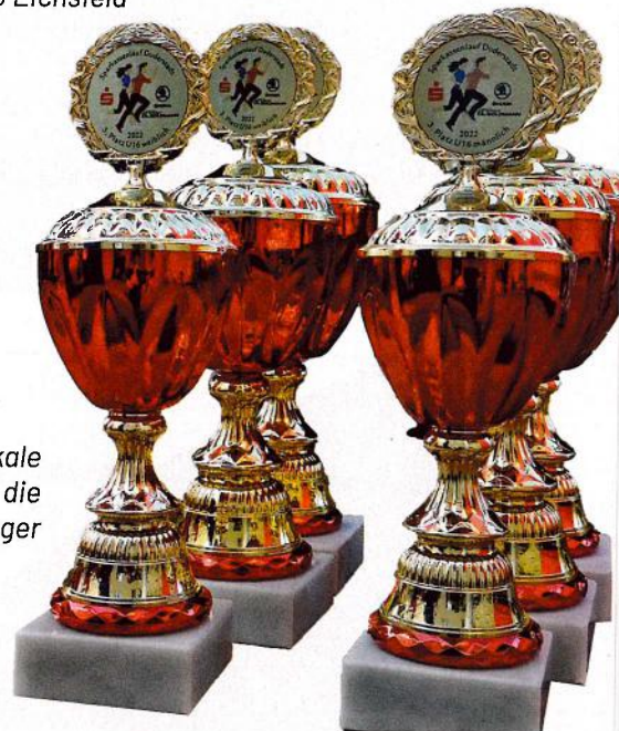
Die Pokale warten auf die Sieger

Während der Veranstaltung sorgt die LG Eichsfeld mit befreundeten Vereinen für kulinarische Abwechslung – vom Grillgut bis zu Cocktails ist alles dabei. Musikalische Unterstützung gibt es von der Brass & Drum Band Mingerode. Die Duderstädter Feuerwehr und Polizei sichern während der Großveranstaltung die Strecke in der Innenstadt. Den Sanitätsdienst übernimmt das DRK Duderstadt.