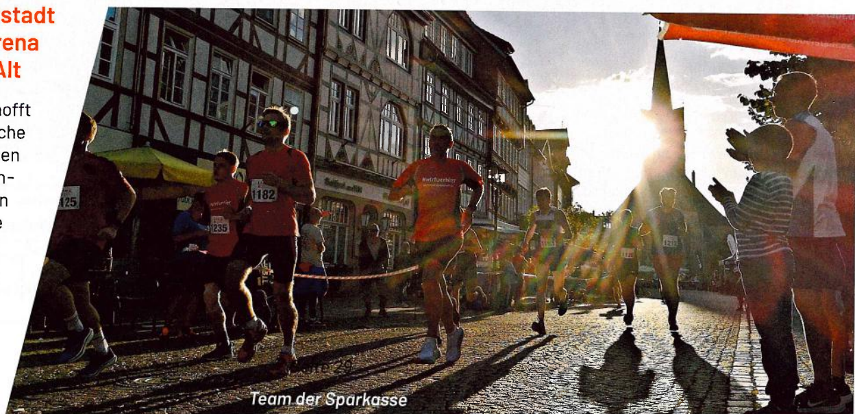
Team der Sparkasse

Das Orga-Team hofft wieder auf zahlreiche Gäste, die hinter den Streckenabspernungen alle LäuferInnen anfeuern dürfen. Die Siegerehrungen finden direkt nach den jeweiligen Läufen statt.